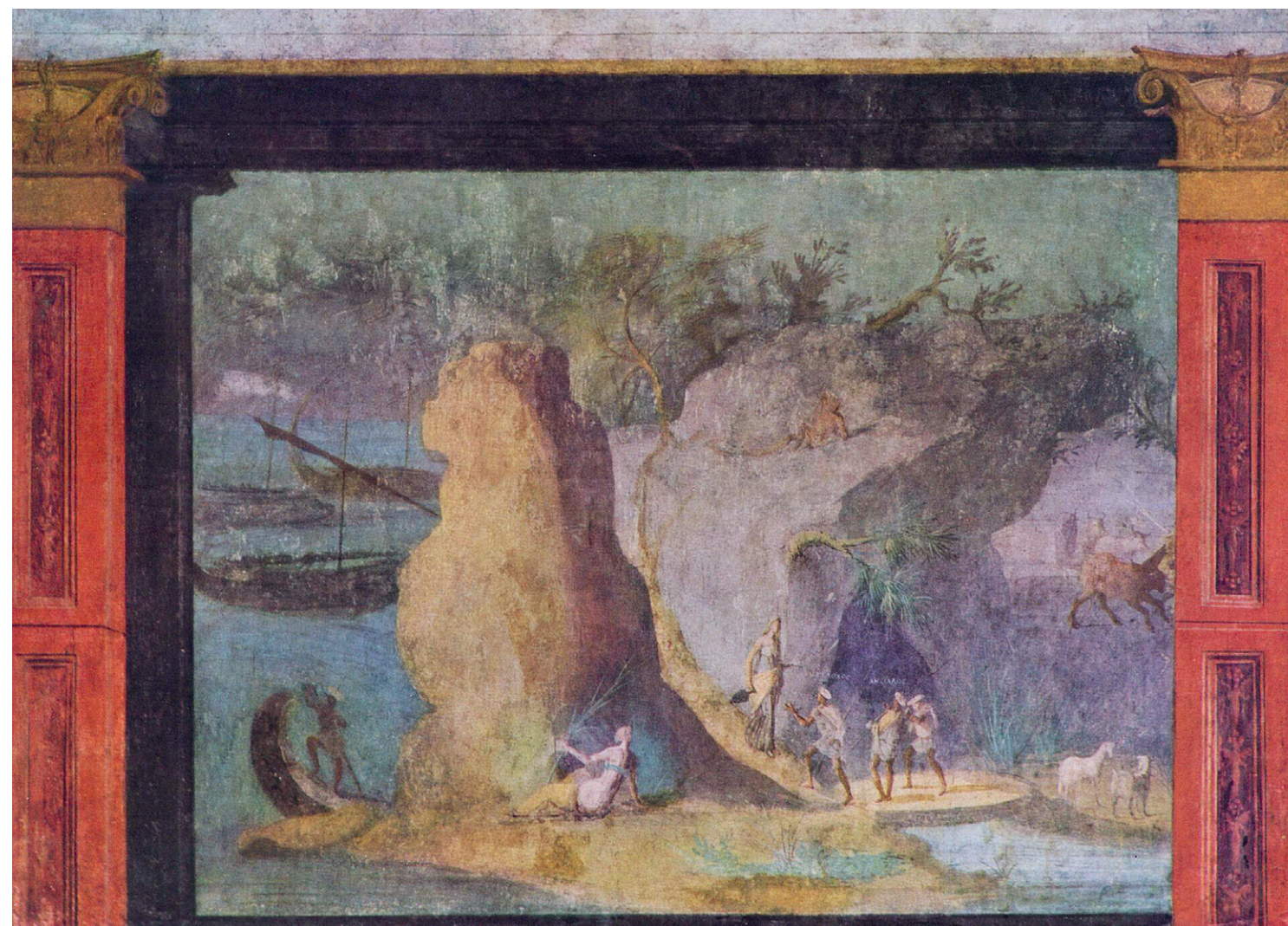
Paysage de l'Odyssée , fresque romaine (125 av. J.-C.), d'après un original grec, ornant la maison de la via Graziosa sur l'Esquilin à Rome. Coll. de la Bibliothèque apostolique vaticane.

Brèves de copies de bac (2013) de Perles du Bac