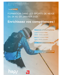
Cliquez pour télécharger l'affiche

Le prix est de 550.- francs par étudiant. Chacun reçoit une allocation de perte de gain (APG). Une demande de soutien financier est possible au «Fonds social et culturel de la HEP».