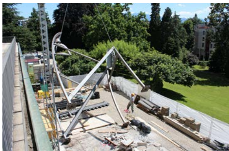
17 juillet 2012 – La sculpture «Clair-Obscur» de Clelia Betta est démontée de son socle et retirée avec une grue.

jouxtaient ont été démontées. A la fin du mois d'août, le niveau 2 a été bétonné, tout