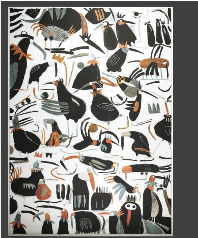
Haydé Oiseaux de jour 2010 Lithographie rehaussée sur Rives 105 x 75 cm Atelier Raynald Métraux