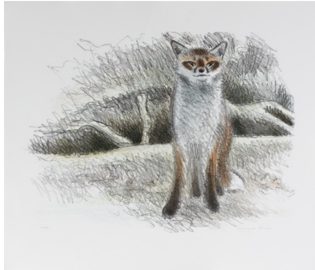
Rimes Jacques, Renard, lithographie, 1999

Curateurs: Nicole Goetschi-Danesi, Alexandra Kaourova, Tilo Steireif