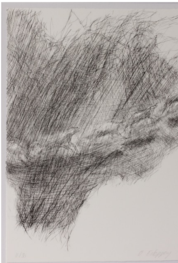
ESTOPPEY Olivier, Sans Titre